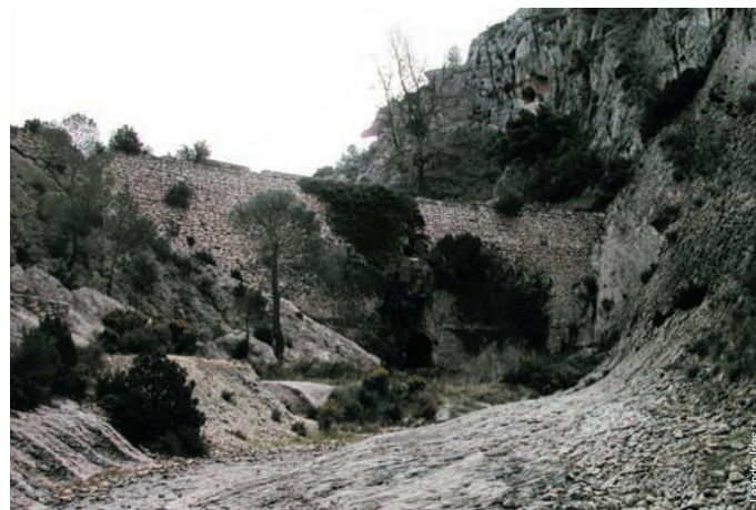
El Pantanet, Petrer